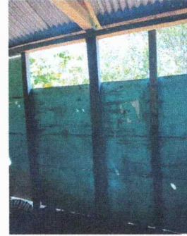
Foto 2: Se observa el deterioro de las columnas y la corona del techo