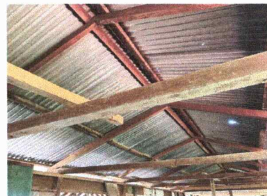
Foto 6: Se observa el deterioro de las vigas y las costaneras del techo de madera

Observación: Si es necesario se pueden agregar hojas adicionales y actualizar el número de hojas.